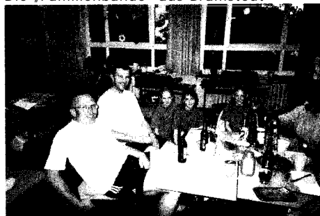
Die Turnerjugend des TUs Eversen Sülze mit ihren Betreuern

Bramstedt, aus der Nähe von Bremen, darauf wurde Wert gelegt. Sie saßen in fröhlicher Runde beim Abendbrot und werteten den Tagesablauf aus. Es war eine richtige Familienbande, die drei Mädels waren aktiv bei den Wahlwettkämpfen und machten Jagd auf die begehrten Stickers. Das jeder von ihnen erfolgreich das Geräteturnabzeichen er- Die „Familienbande“ aus Bramstedt