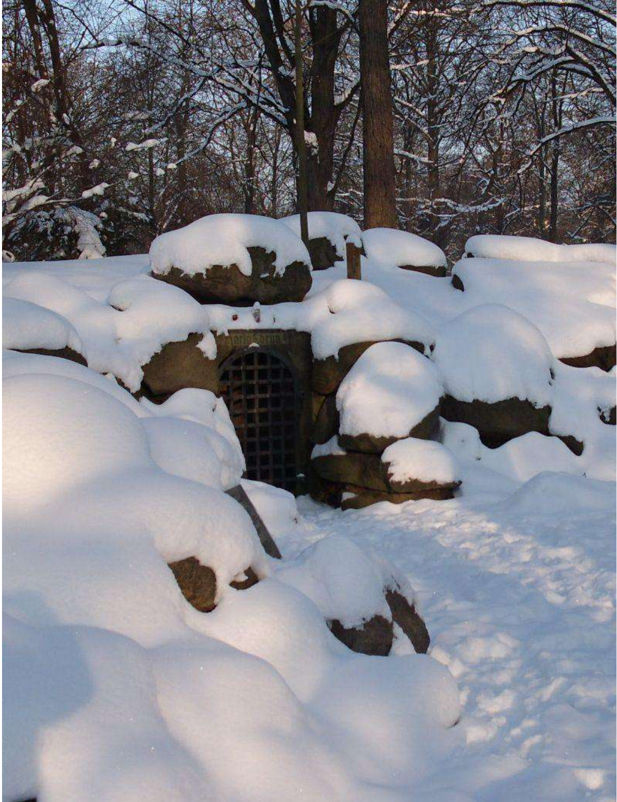
Marienquelle im Winter 2010