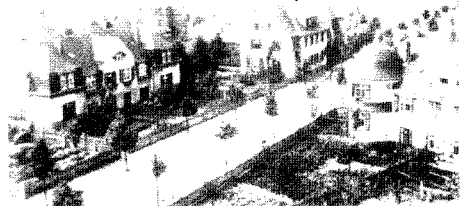
MARGA, Briesker Straße, Blick nach Westen 1920

durch die einheimische Dorfbevölkerung nicht mehr abgedeckt werden. Für die Neuansiedlung von Arbeitern aus den deutschen Ostgebieten und dem osteuropäischen Ausland musste Wohnraum geschaffen werden.